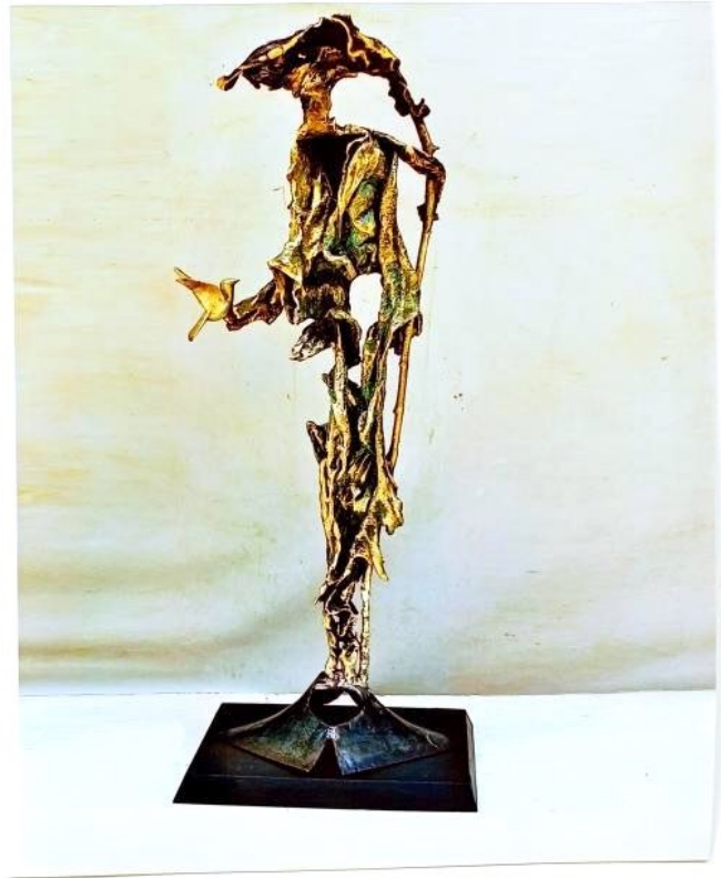
Exemple d'oeuvres en bronze organique l'artiste bronzier Abdoulaye Kabore.